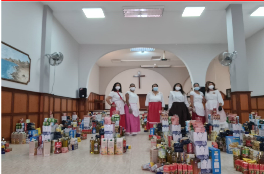
Reparto de alimentos